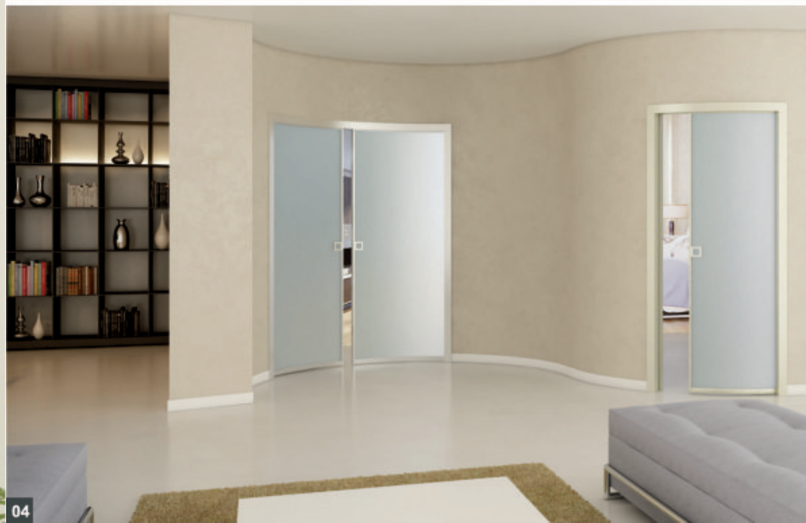
03-04 PLAN-15 CURVA ad un'anta in alluminio/vetro e stipite in alluminio PLAN-15 CURVA a due ante in alluminio/vetro e stipite in alluminio