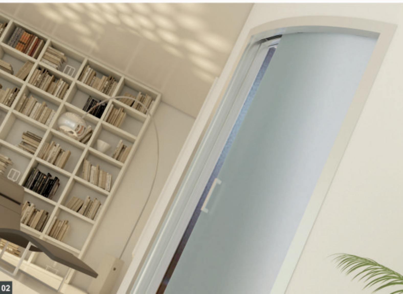
01. PLAN-FAST CURVA ad un'anta in vetro e stipite in alluminio 02. Particolare PLAN-FAST CURVA ad un'anta in vetro e stipite in alluminio